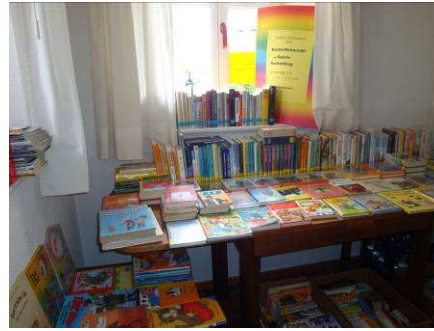
Flohmarkt am Frühjahrsmarkt