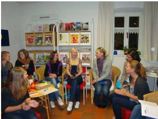
Jugendveranstaltung „Book Slam“