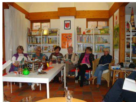
„Pop und Poesie“